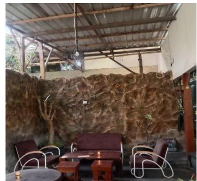
Gambar 1.1 Tempat untuk pengunjung Data Primer 2023

Lokasi yang cukup strategis dimana untuk masuk ke kafe tersebut kita melewati para pedagang yang memiliki toko bunga, dan tidak jauh dari sana ada splendid (berjualan berbagai macam hewan). Konsumen dapat tertarik dengan hal ini karena letaknya yang cukup untuk merepresentatifkan nuansa alam. Harga yang ditawarkan juga sangat terjangkau, rasa yang ditawarkan sudah baik, harga juga cocok dikantong pelajar, Suasana yang ditawarkan oleh kafe ini, dapat menarik minat konsumen karena biasanya kafe yang terdapat di perkotaan itu cukup banyak konsumen dan lain sebagainya yang membuat konsumen yang tidak terlalu suka keramaian tidak tertarik untuk kesana, tetapi kafe ini menawarkan suasana yang berbeda, kafe ini rindang dan dipenuhi oleh pohon - pohon,