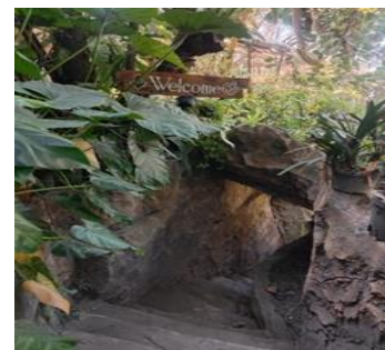
Gambar 1.2 Jalan untuk menuju Café Pibir Lepen. Data Primer 2023