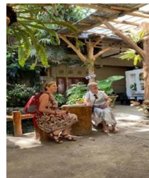
Gambar 1.6 Pengunjung dari Luar Negeri Data Primer 2023

Berdasarkan penelitian yang telah dilakukan, analisis hasil penelitian kelompok kami, dijelaskan pengunjung tertarik ke café pipir lepen ini karena suasananya yang sejuk. Sebagaimana yang dituturkan oleh informan kami bahwa pemandangan yang rindang, ditambah dipinggir sungai yang memberikan kesan menyenangkan, sehingga memberikan kesejukan, kesegaran karena ditambah bisa melihat air sungai dimana nuansa alamnya sangat terlihat, dan memberikan ketenangan di tengah padatnya lingkungan perkotaan. Selain itu informan juga mengatakan bahwa “café Pipir Lepen ini memberikan suasana café yang berbeda yang tidak dimiliki oleh semua café – café pada umumnya” dimana café ini memberikan pemandangan yang berbeda yaitu sungai, dimana sangat jarang café yang ada nuansa alam seperti ini, pas juga untuk healing, adanya suara gemericik air yang berasal dari sungai juga dapat melepas stress juga, suasana yang tidak terlalu panas karena tertutup oleh pohon – pohon dan tumbuhan lainnya cocok untuk pagi maupun sore hari. Lokasi kafe ini terletak di antara pasar bunga yang memberikan kesan sejuk dan segar di tengah padatnya lingkungan perkotaan, lokasinya dekat dengan splendid jadi pengunjung juga bisa melihat hewan juga dengan jalan santai ke splendid. Banyaknya pengunjung yang datang di café ini menyebabkan omset café ini kira - kira sebanyak lima sampai 6 juta rupiah setiap bulan.